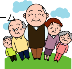
グループホーム「里の家2号館」 完成イメージ図

一人一人の介護計画（ケアプラン）を作成し、より豊かな生活となるよう、家事や楽しみごとを一緒に行い、日々のケアを致します。